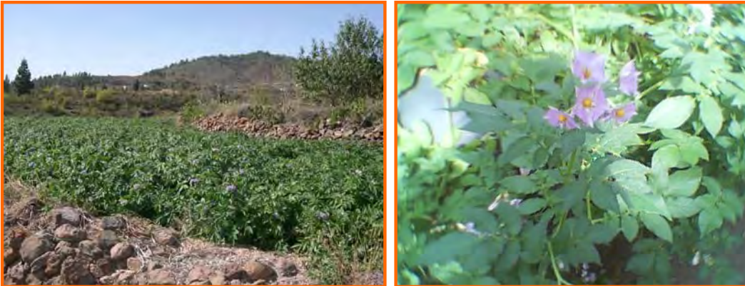
Cultivo de papa "Negra Yema de Huevo" en Vilaflor

Sin embargo, en las plantaciones de agosto, sobre todo si no se dispone de riego, se recomienda aumentar un poco la profundidad de plantación, con el fin de evitar las altas temperaturas de las capas superficiales del terreno. En caso de que se prevean ataques de polilla también resulta conveniente plantar a más profundidad.