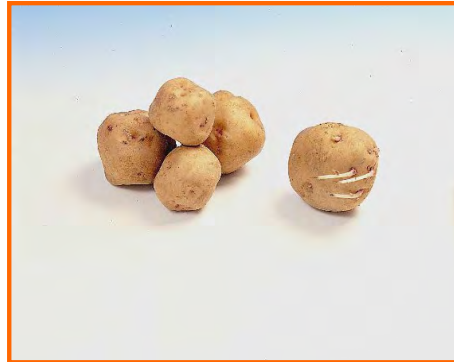
Semilla de la variedad Bonita Ojo de Perdiz

En el momento de la plantación es conveniente que la papa esté desarrollando grelos por más de un ojo. Esto favorece una emergencia rápida y uniforme, facilitando las labores posteriores del cultivo (control de malas hierbas, arrendado, etc.). Los mejores grelos son aquellos que se han desarrollado en condiciones de luz difusa (sin sol directo), ya que son más resistentes y sufren menos daños durante su manipulación y plantación.