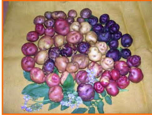
Distintas variedades de papas locales

Para las variedades "Bonita Ojo de Perdiz" y "Colorada de Baga" la fecha de plantación va de Octubre a Enero. Hay que resaltar que el comportamiento de la variedad "Bonita Ojo de Perdiz" es un tanto irregular, ya que parece tener unas necesidades importantes de bajas temperaturas durante el cultivo para que la tuberización tenga lugar; en caso contrario, es probable que se "vaya en rama".